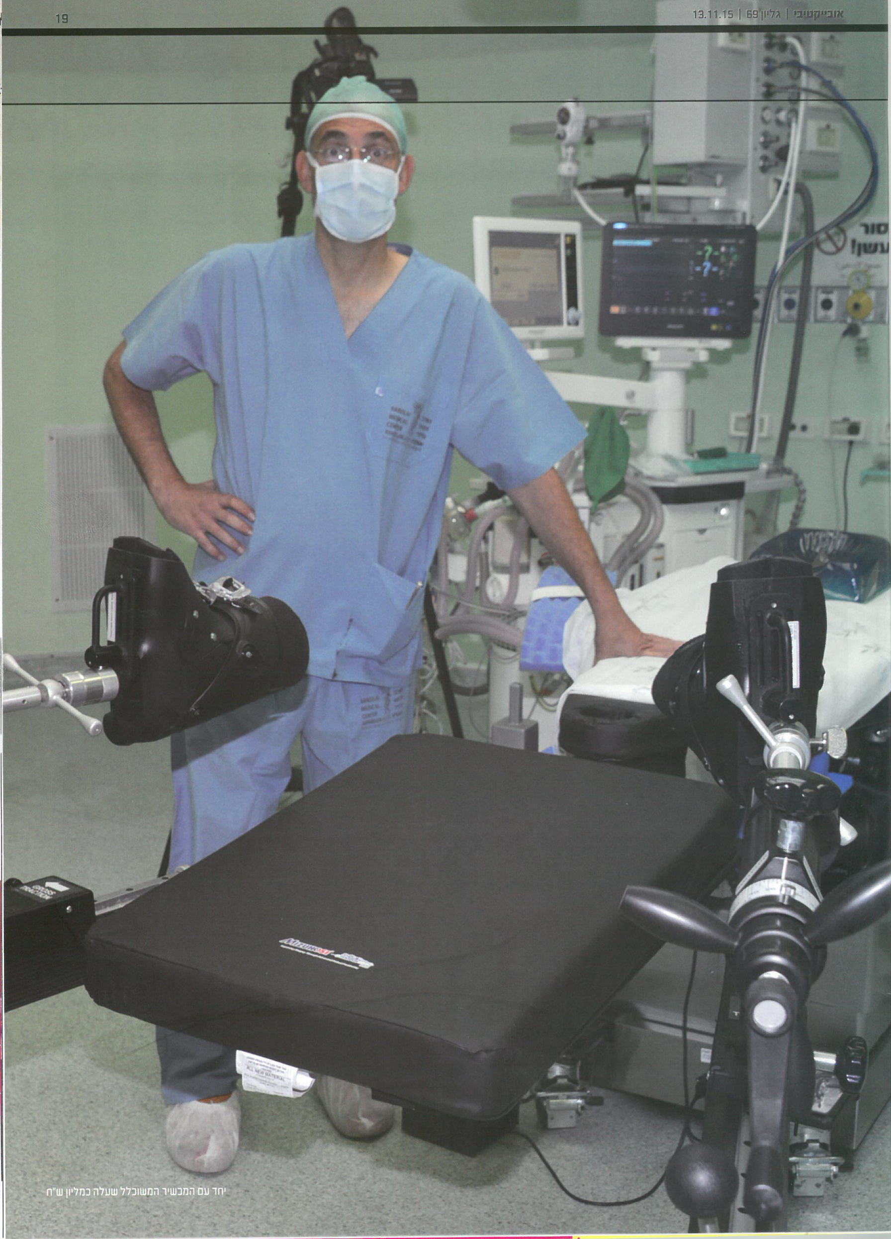
יחד עם המכשיר המשוכלל שעלה כמליון ש"ח