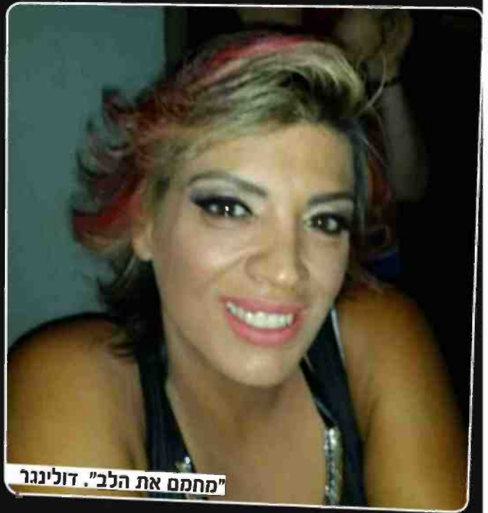
"מחמם את הלב". דולינגר