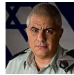
סדר בתעמולה: השקרים על עזה שהופרכו וממשיכים להסתובב