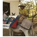
ספריות החמורים מקולומביה: הנשק להעצמה המונית