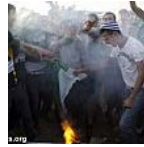
להחזיר את הכהניזם לממדים הטבעיים שלו