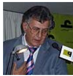
זקוף גו פסע והלך לעולמו: נפטר המשורר סמיח אלקאסם