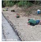
לרדת למקלט בשדרות, להימלט לכפר יפיע, לחשוב על עזה