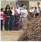
שדאעש יפחדו מאיתנו. מזרחה בטרמפים: חלק עשירי