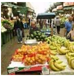
סלט הוא לא מגף של גוצ'י, מזון בריא אינו מותרות