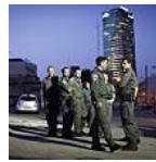
"פה זה חוקי": שוטרי מג"ב היכו גבר אריתראי בדרום ת"א