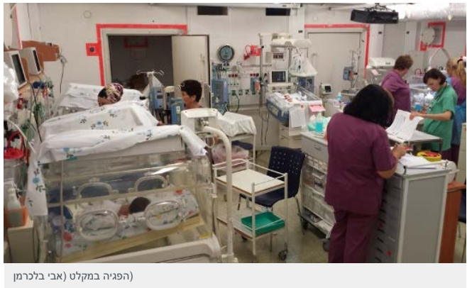
(הפגיה במקלט (אבי בלכרמן